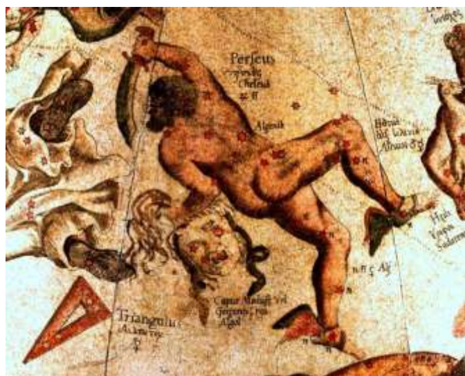
Fig.7- Pers-eú-s, il titano greco elevato fra le stelle e corrispettivo dell'indiano Par(a)ç-u-râma , nonché del biblico Lamek , ossequiato durante il VI Ciclo Avatarico (G.Mercator, 1.551; coll. di mappe celesti, Harvard)

Vale a dire, in rapporto all'Ecumene Nordorientale; donde ha preso le mosse il piú tardivo 'Ciclo dell'Ariete' 62 , sostanzialmente coincidente col VI Ciclo Avatarico.