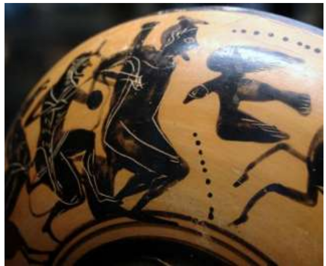
Fig.2- Eracle libera Prometeo (l’Uomo Cosmico) – figlio di Giapeto = Iaphet – dalla tortura dell’Aquila (asterismo presso l’Aquario), che gli rode il fegato; cioè è posizionata al Discendente Vernale durante l’Era del Leone (10.960-8.800 a.C.), in cui secondo Platone avvenne il Diluvio Atlantideo (cratere ateniese a figure nere, c.500 a.C., Mus. del Louvre, Parigi)

di Urano), come dimostra altresì la sua duplicità gemellare (in tutta evidenza i due archi zodiacali, ascendente e discendente), è chiaro che il fegato di tale macrantropo rappresenta in tal caso la metà del corpo, cioè il Discendente vernale all’epoca del Diluvio Atlantideo.