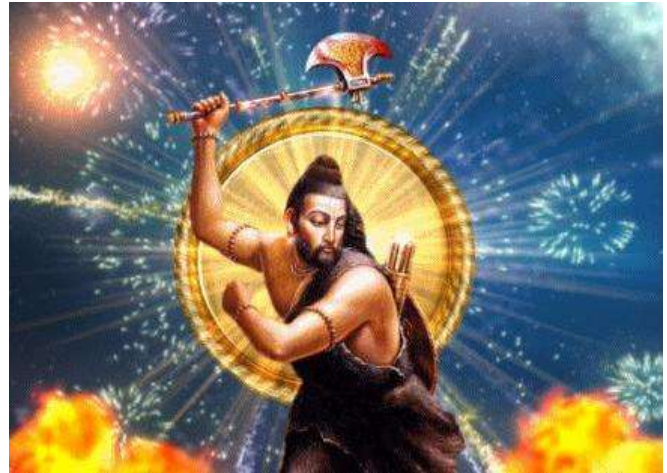
Fig.6- Paraçu(râma) coll'Ascia ( Paraçu ), emblema polare di Canopo (ill.contemp. Timgonkart, 10-11-10)

tal modo abbiamo apportato soltanto una piccola correzione a Guénon, così come ad Evola, riciclando la provenienza iperborea di Paraçu-Perseo come post-iperborea.