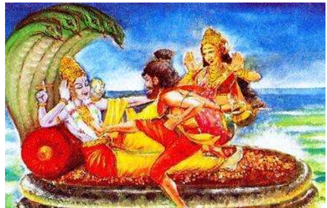
Fig.1- Nell'Isola Bianca il dio ario Viṣṇu riposa sul pentacefalico serpente Ananta – simbolo dell'eterica spirale dell'Infinito – sotto forma brahmanizzata di Nârâyaṇa , ricevendo un visitatore il quale gli pone un piede sul petto, poiché costui ha seguito una via che lo identifica al cuore della Divinità (ill.cont., on line)

per la Terra Nord-asiatica ed al IX per quella Nord-atlantica. È unicamente allo Çvetadvîpa , tuttavia, che possiamo assegnare la definizione hindu di 'Isola Bianca'; o, se preferiamo, quella ellenica di 'Terra Iperborea'.