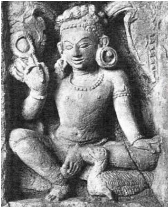
Fig.4- Varuṇa , la divinità uranica venerata dall'Uomo – effigiato dallo Harṇsa – nel II Ciclo Avatarico (altorilievo indiano d'epoca medievale, on line )

Più avanti (ib., 8 -9) si afferma che i figli di Borr (le genti boreali) portarono Ymir (il seme umano) nel mezzo di Gin-nungagap (cioè nel mezzo della zona tropicale), e colà individuarono i 4 Pilastrini del Cielo ponendo 4 Nani a sorreggerli. Diedero un posto a tutti gli astri, alcuni fissi in cielo; ad altri che vagavano liberamente diedero una rotta da percorrere e in tal modo, secondo quanto attestano le più antiche conoscenze, cominciarono la divisione dei giorni ed i calcoli annuali. Il punto di vista descritto nell'Edda, si noti, è divino, non umano. Ragion per cui, da ciò che rimaneva della prima razza umana (i Giganti del Gelo) è stata foggia-ta una nuova razza (i Giganti della Mon-