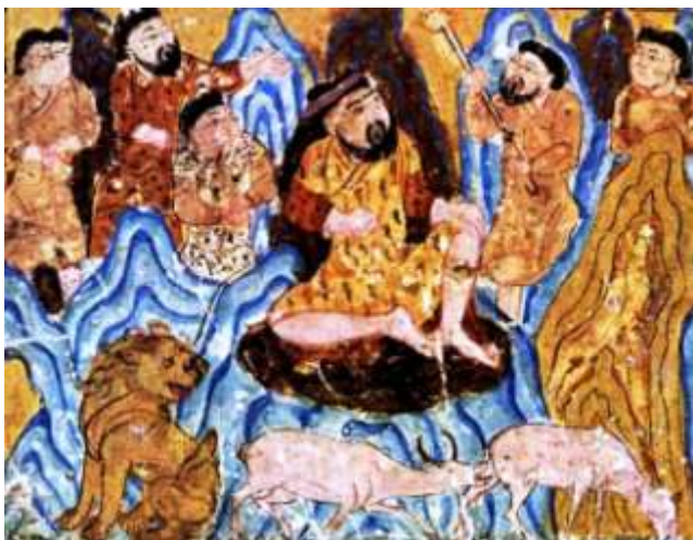
Fig.3- Gayumart, primo re umano ed equivalente airya di Yima nei panni di uomo-dio, sulle innevate Montagne Paradisiache allorché in un clima uniforme il leone viveva in pace colla gazza (miniatura persiana del XIV sec., Lib.Gall. d'Arte, Washington, B.Gray, 1977)

ormai che l'autore avesse frainteso il concetto, ci siamo accorti che altri (il De Santillana) l'interpretava come spazio celeste fra i due tropici. Ciò senza dubbio dà ragione, sia pur indirettamente, allo scrittore siciliano; poiché si tratta a ragion veduta, secondo la Gylf.- 5, del passaggio da una terra circumpolare "incrostata di strati di ghiaccio e di brina" (Niflheimr) ad una subtropicale "bagnata dalla pioggia e battuta dal vento", oltre la quale era posta una regione illuminata dalle scintille e dai bagliori del Muspell" (il Sud). Cfr. anche Ev., art.cit., p.9. In questo caso l'autore si limita a parlare, però, di 'terra sacra posta ad Occidente'. Da notare che l'Edda (i. 5-6) riconosce ad Ymir, il primo gigante del ghiaccio (androgine, secondo il Turville-Petre, ed omologo dello Yama/ Yima indoiranico), la primogenitura.